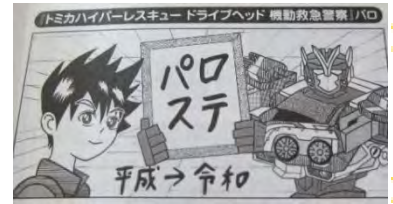
アニメージュ 2019年7月号

しばらく絵から遠ざかっていた時に「ドライブヘッド」というアニメに出会いました。純粋だった小さな頃の記憶がよみがえり、また描きたい気持ちが沸き上がってきたそうです。絵を描く楽しさを思い出させてくれたこのアニメにはとても感謝している、恩返しをしたいと思い、描いた絵がこちらです。